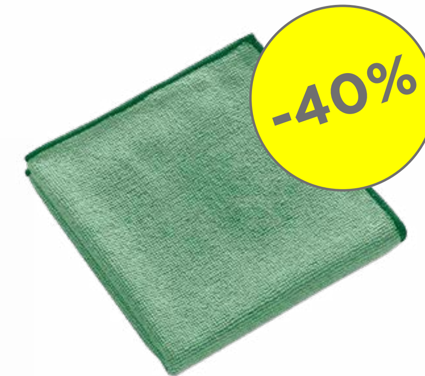
PANNO PULIZIA MICROFIBRA