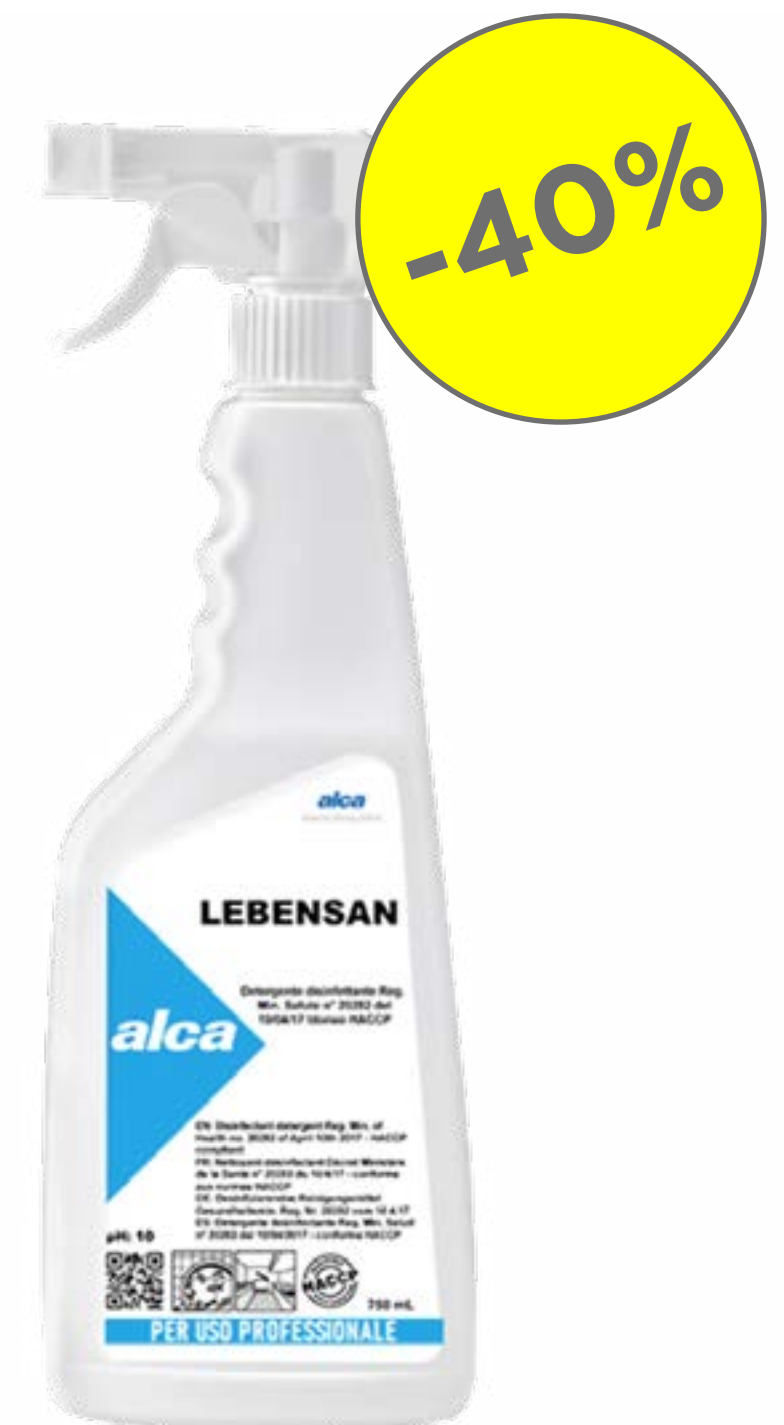
DETERGENTE BATTERICIDA LEBENSAN