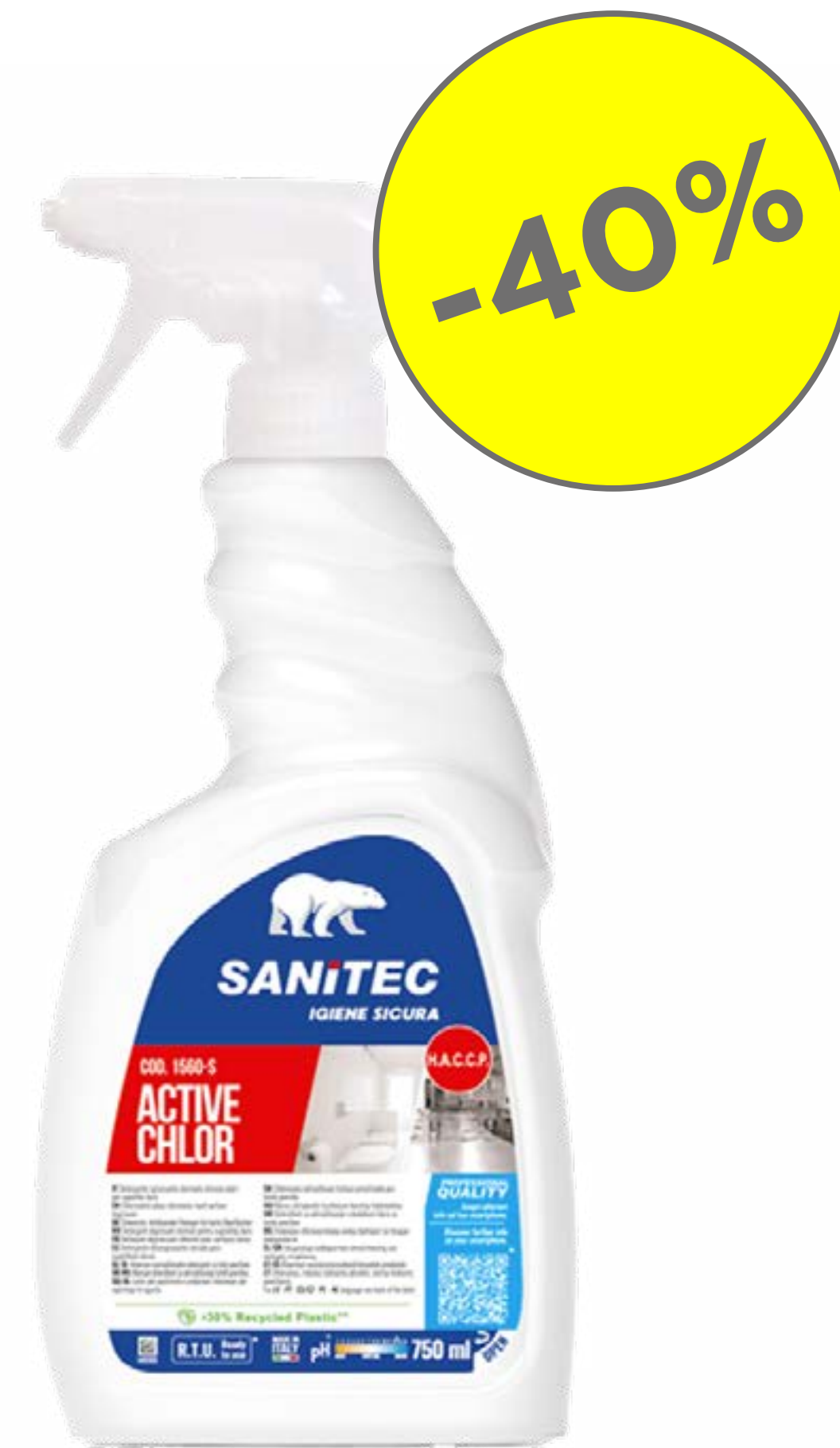
DETERGENTE ACTIVE CHLOR