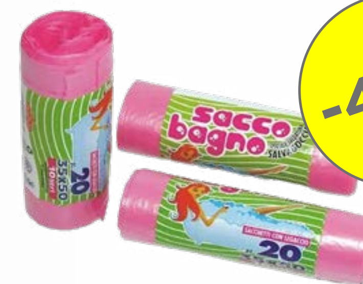
SACCHI DA BAGNO