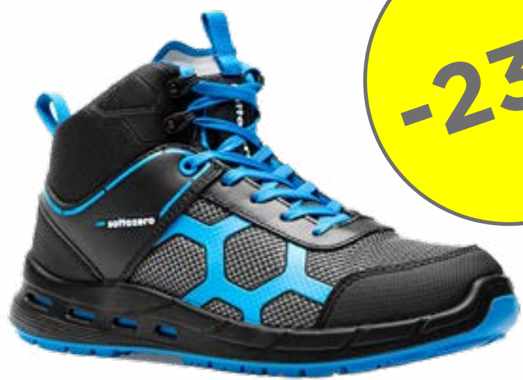
SCARPA S3S JUMBO