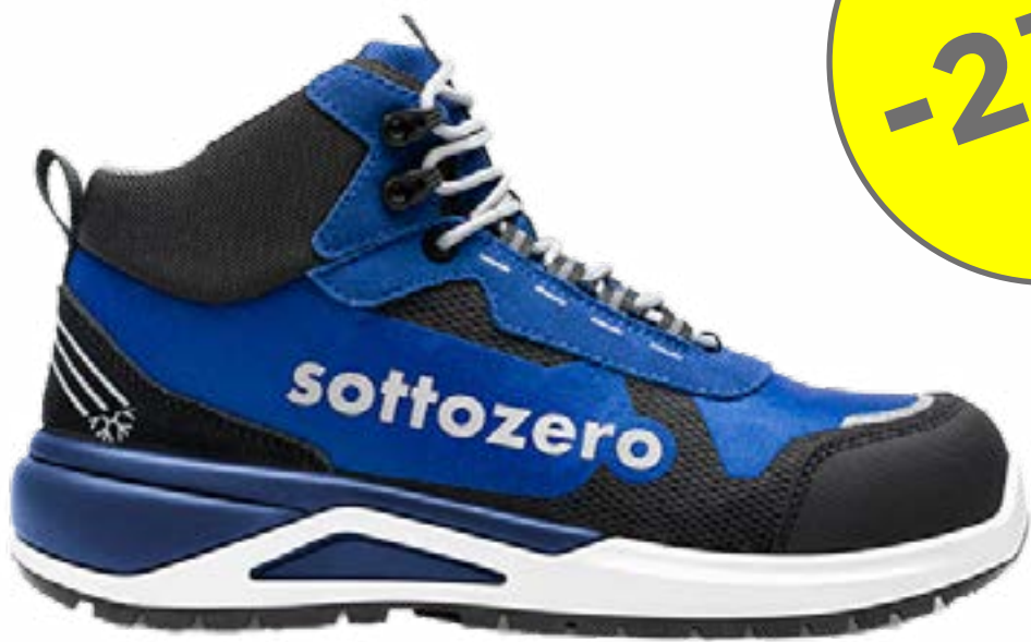
SCARPA S1PS CONCORDE