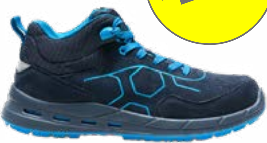
SCARPA S1PS MIDI DEFCON