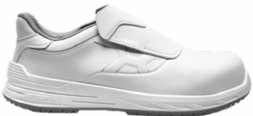
SCARPA S2 WASABI