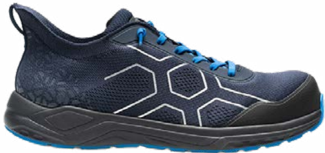
SCARPA S1PS FLEXIFLY