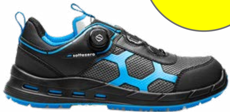
SCARPA S3S UFO PLUS