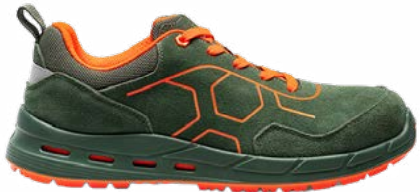
SCARPA S1PS NORAD